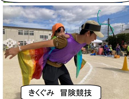
きくぐみ 冒険競技