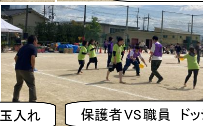
保護者VS職員 ドッジボール