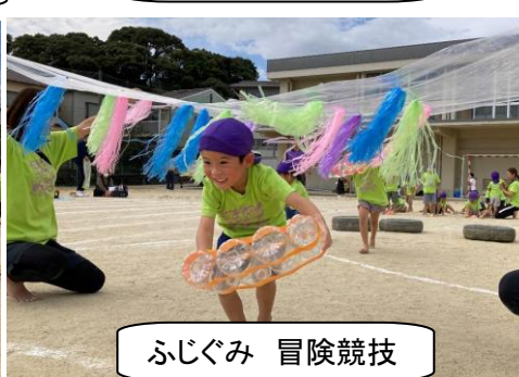
ふじぐみ 冒険競技