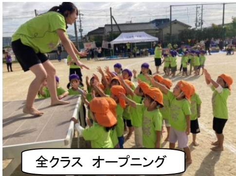
全クラス オープニング

心地よい秋晴れの中、第3回みんなのき三山木こども園・みんなのきねーねの運動会が開催されました。『みんなぼっちのこりびん』をテーマに、こどもたち一人ひとりが普段の遊びの一環として楽しみました。今年度からお手伝いいただいた保護者のみなさま、最後までこどもたちをあたたく見守ってくださった保護者のみなさまありがとうございました。みんなで『みんなぼっちのこりびん』を感じられた運動会になったこと職員一同感謝しています。