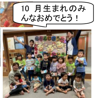
10月生まれのみんなおめでとう！