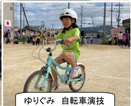
ゆりぐみ 自転車演技