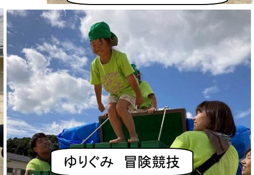
ゆりぐみ 冒険競技