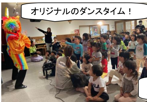
オリジナルのダンスタイム！