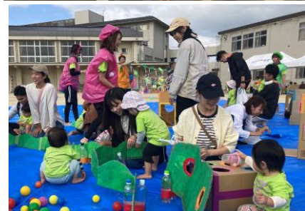
つぼみぐみ・ももぐみ親子競技