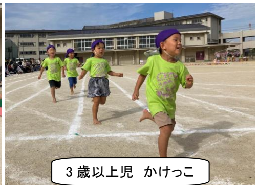
3歳以上児 かけっこ