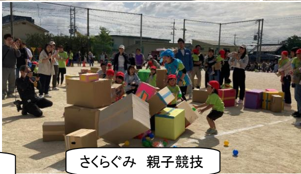
さくらぐみ 親子競技