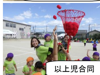
以上児合同 玉入れ